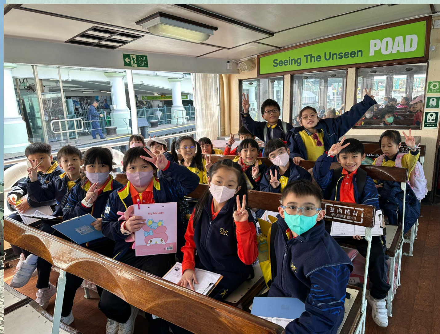
我們一起乘坐 天星小輪到尖沙咀了!