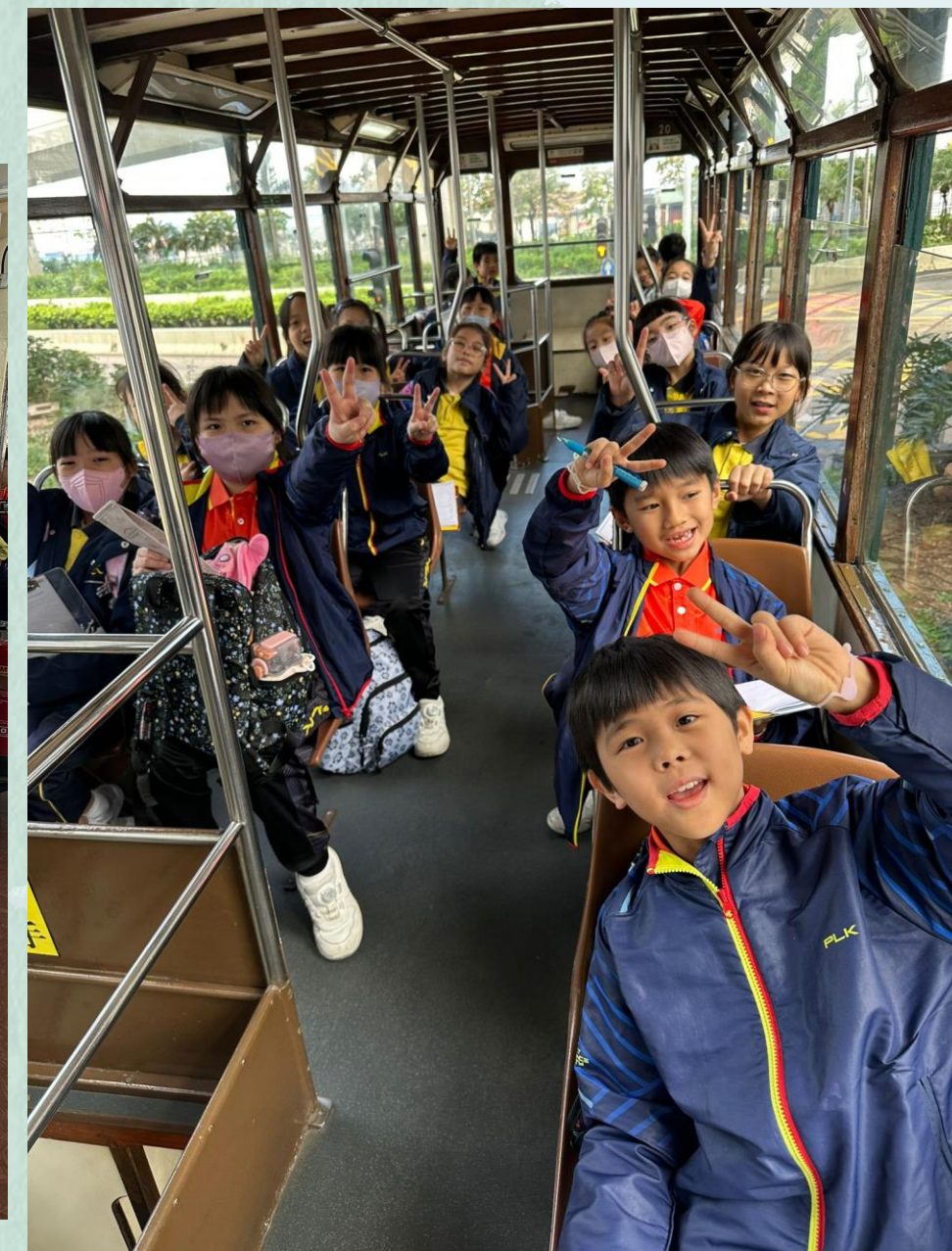
大家一起乘坐 電車，真開心!