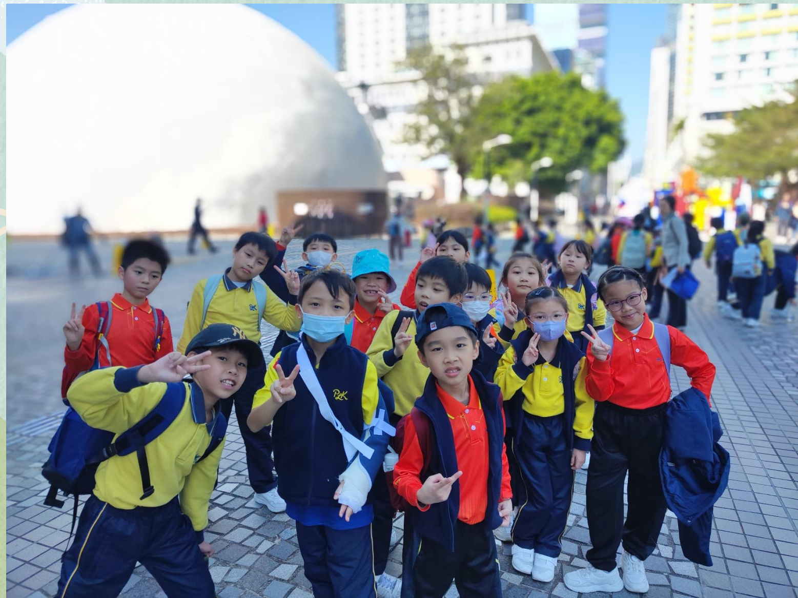
參觀位於尖沙咀的香港太空館