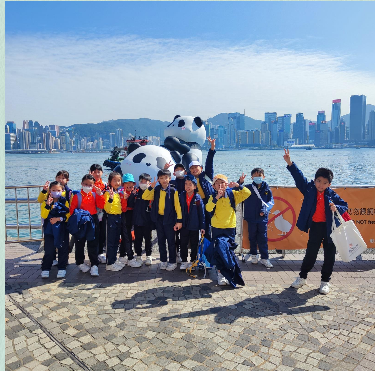
親親大熊貓，真可愛呀！