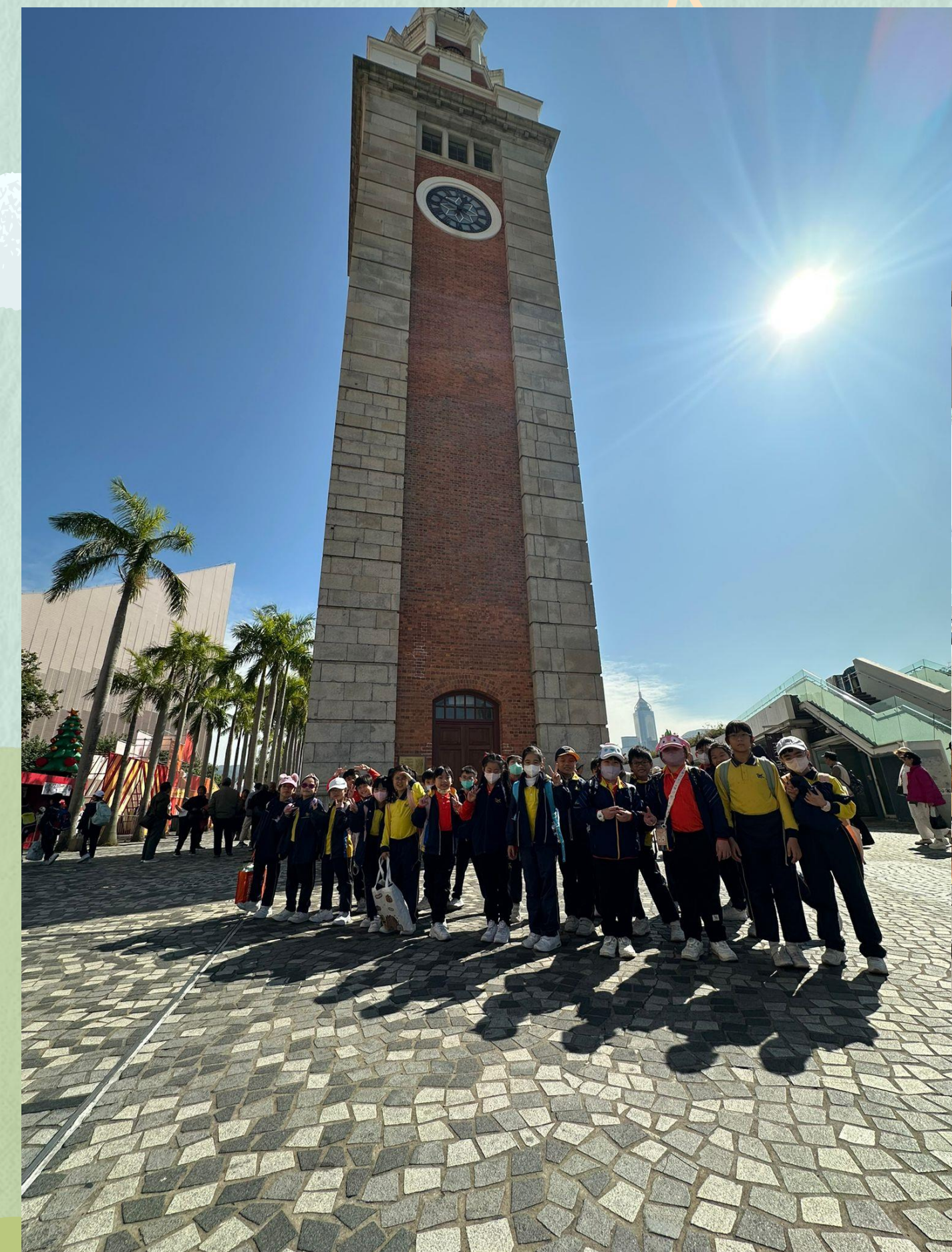
尖沙咀的鐘樓真高啊!