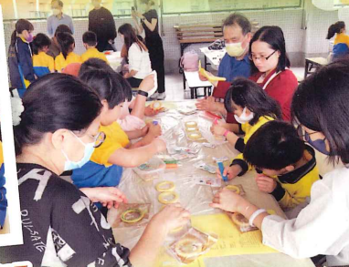
家長和同學都十分投入