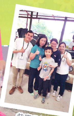
恭喜各位被抽中的幸運兒