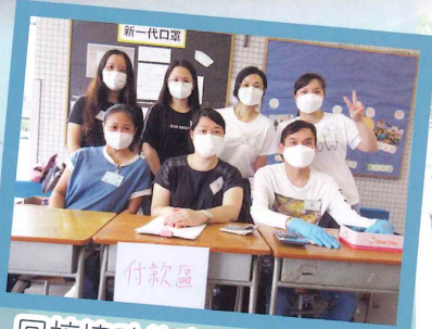
回校協助的家委合照留念