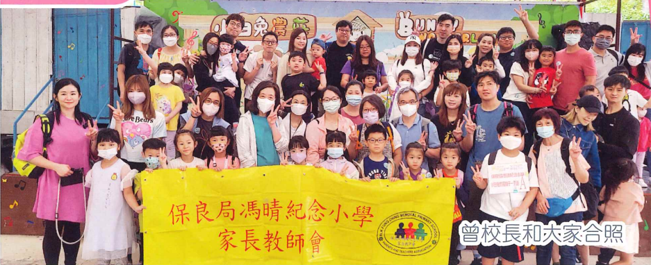
保良局馮晴紀念小學家長教師會