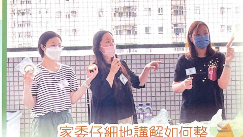
家委仔細地講解如何整玻璃曲奇