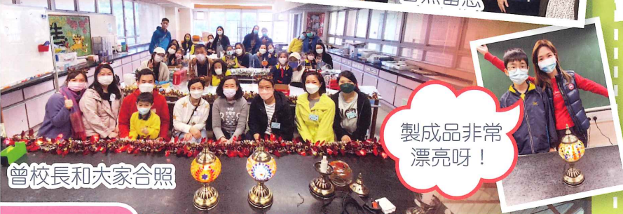
曾校長和大家合照