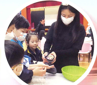
同學小心翼翼地與小刺蝟接觸