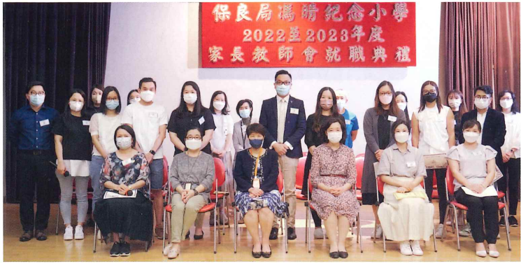
第二十二屆家長教師會合照