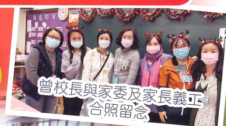
曾校長與家委及家長義正合照留念