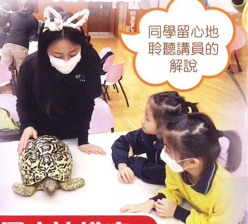
同學留心地聆聽講員的解說