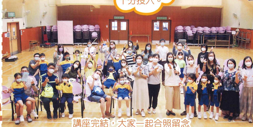
講座完結，大家一起合照留念