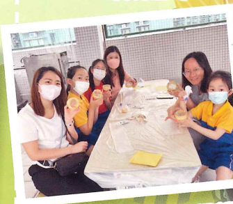
大家做好的曲奇都很靚呀