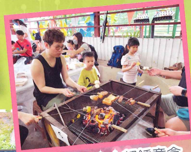
燒雞翼，人人都鍾意食