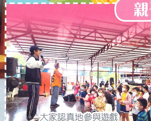
大家認真地參與遊戲