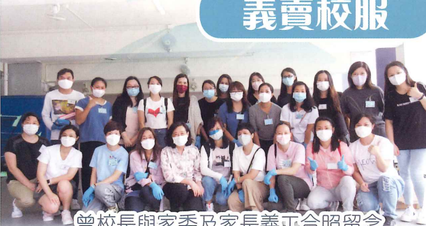
曾校長與家委及家長義工合照留念