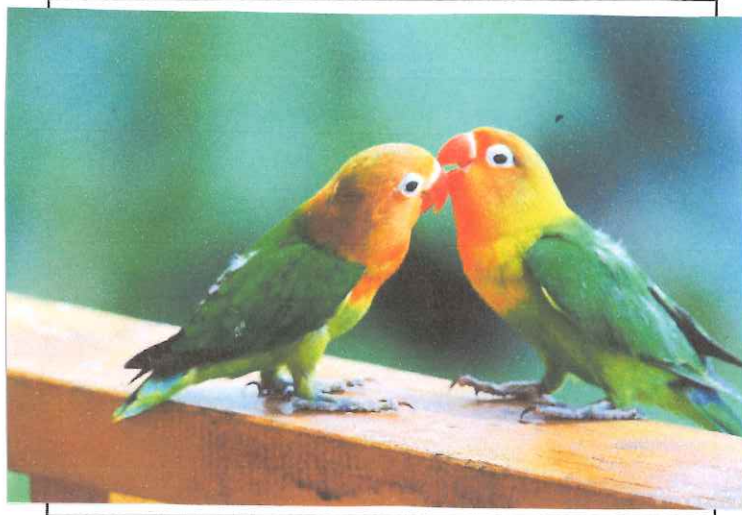
小太陽 牡丹鸚鵡 武鳥 武鳥