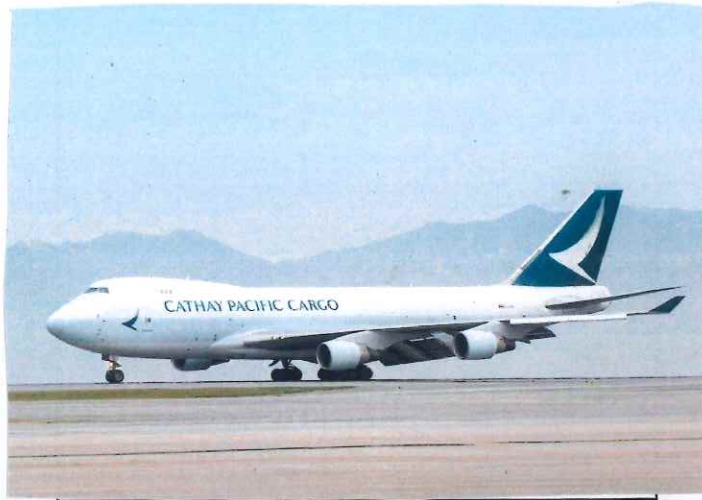
空中巴士A330飛機 (國泰航空)