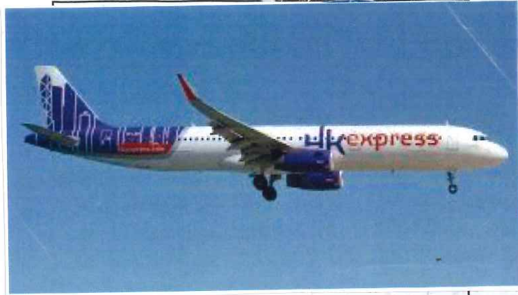
空中巴士A320飛機 (HK express)