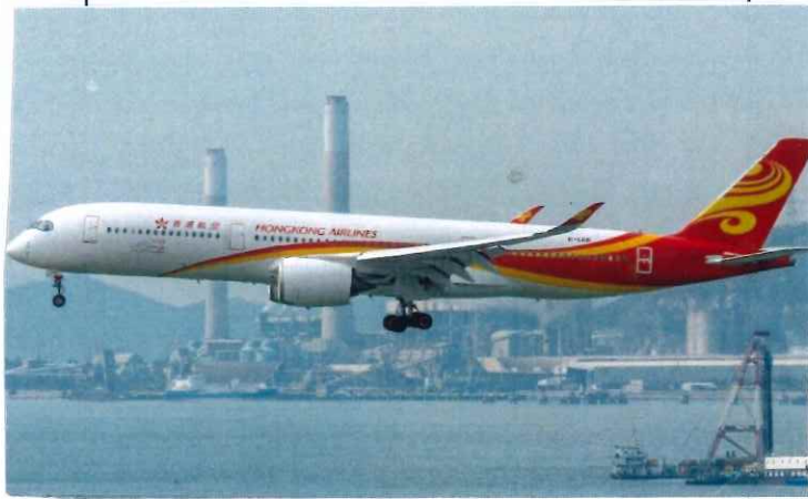
空中巴士A330飛機 (香港航空)